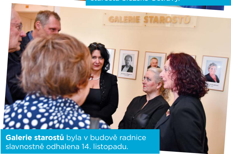
Galerie starostů byla v budově radnice slavnostně odhalena 14. listopadu.