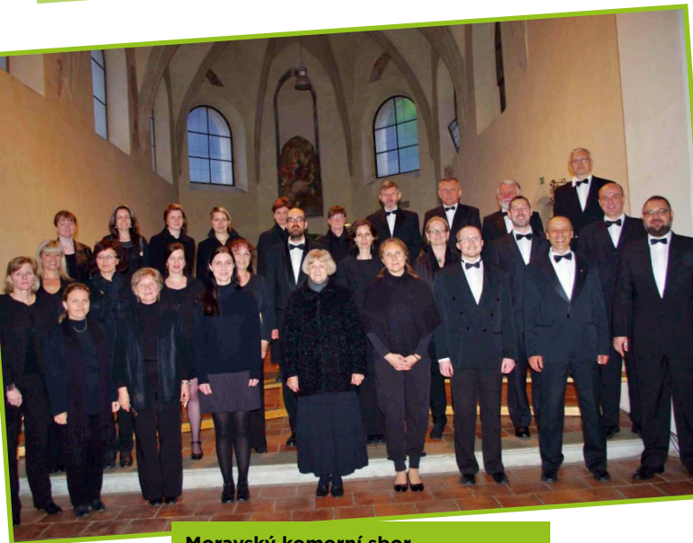
Moravský komorní sbor