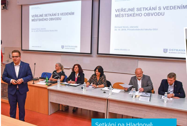
Setkání na Hladnově