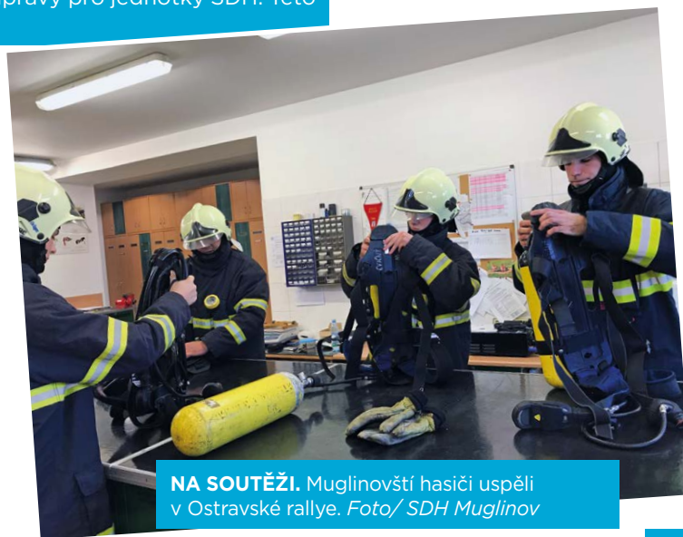
NA SOUTĚŽI. Muglinovští hasiči uspěli v Ostravské rallye.

Petr Gvuzď, velitel družstva JSDH Ostrava