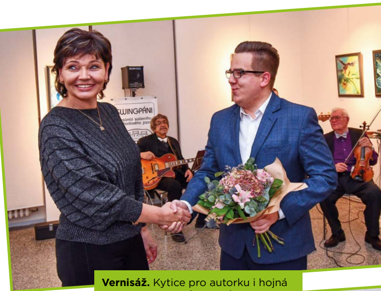
Vernisáž. Kytice pro autorku i hojná účast návštěvníků.