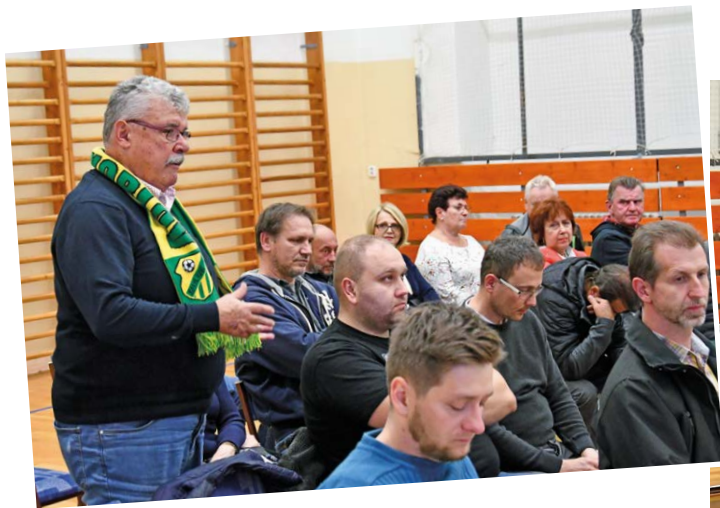
Setkání v Koblově